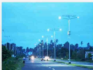
Solar Home System